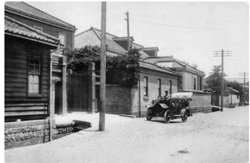
写真 11. 東京病院 (21-32)。