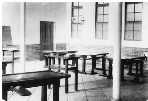
写真10. 雨天体操場 (17) と解剖学教室 (18). 上: 西側から写した雨天体操場 (左の平屋建) と解剖学教室 (右). 中: 雨天体操場で行われる明徳会、合掌から始まった。 下: 解剖学実習室。