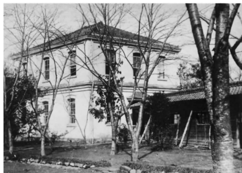
写真2. 有志共立東京病院 看護婦教育所(P)。東南方向から写す。後に東側に手術室の建物(Q)ができたため東側にあった渡り廊下と入口は図1のように南側に移された。

このうち最も興味深いのは煉瓦造り2階建てのG(第1病棟)とこれと対称的なH(第2号病棟、写真3)である。それは兼寛が留学したセント・トーマス病院のナイチンゲール病棟をモデルにして造られたものであった。構造の特徴は写真3.下のようなワンルーム形式である。天井は高く、広い床には左右1列に15床ずつのベッドが並び、1ベッドに1つずつの上下に長い窓が配置してあった。ベッドの間もゆったりしていて、とくに左右1列に並んだベッドとベッドの間の広い空間にはナースステーションが置かれていた。また入口の