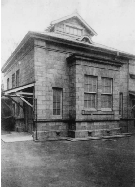
写真 13. 東京慈恵会医院医学専門学校 病理解剖室 (14).