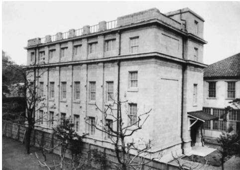
写真 14. 御大典記念館 (15). この建物の右奥に病理学・細菌学教室の建物が 見える。

て、建坪 55 坪 (延坪 169 坪余) で、解剖標本、病理標本の陳列所として使用された。その後、1 階は図書部が使用し、関東大震災 (大正 12 年 9 月) の折りには、その 1 階は消失したが、2 階、3 階の標本は無傷で難を遁れた。