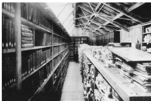
写真9. 東京慈恵医院医学専門学校 図書館 (7).

実験台は甲板一寸ばかりの厚さのケヤキ造りの立派なものでありました」と言っている (写真8).