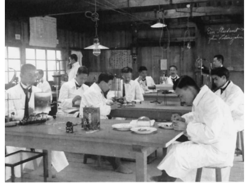
写真8. 東京慈恵医院医学専門学校 生理学教室 (5). ここで行われる生理学実習.

東京慈恵医院医学校は明治36年 (1903) 6月, 医学専門学校に昇格し, 以後卒業生は医術開業試験を受けることなく開業免許が授与されることになった (明治38年10月). それ以前は卒業しただ