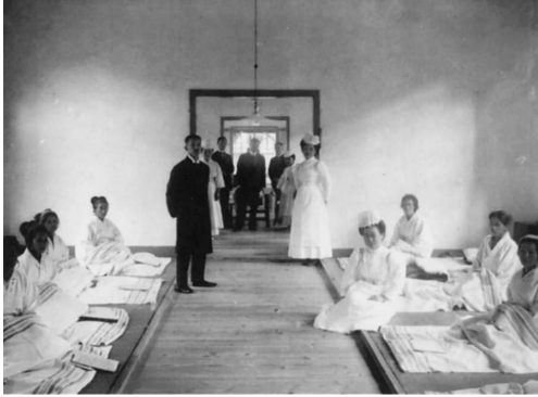
写真4. 東京慈恵医院 第4号病棟 (M) の内部。 畳の大部屋であり、中央が通路になっている。