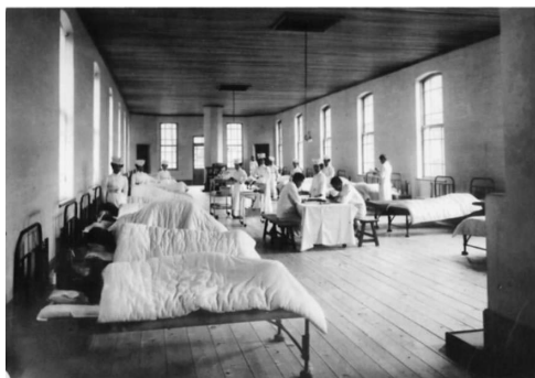
写真3. 東京慈恵医院 第2号病棟(H)。上: 全景 東南側から写す。下: 構造はワンルーム形式。