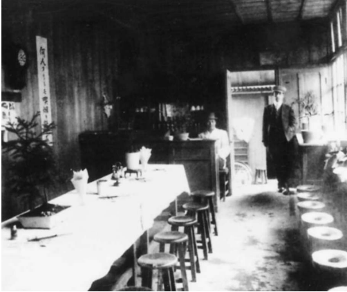
写真7. 東京慈恵医院医学校 食堂 (8).

学教室, 組織学実習室), 11 (講義室) をふくむ建物を西側から撮ったものであるが, これの南北の両窓際には顕微鏡を並べて組織を観察する, 東西に細長い部屋があり (写真6. 下), その内側に物理・化学教室, 講義室があった. 8 (食堂) は写真7のように小さいものであるが, 1学年20人未満の全体4学年の学生数ではこのぐらいの大きさで十分だったのかも知れない.