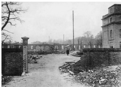
写真16. 関東大震災による惨状。

上：第3号病棟（L）の焼け跡から焼け残った御大典記念館（15）と外殻だけになった看護婦教育所（P）を見る。