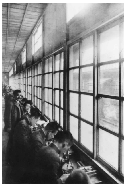
写真6. 東京慈恵医院医学校 校舎（9, 10, 11）. 上：西側から写す。 下：窓側の組織学実習室。