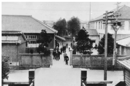
写真12. 東京慈恵会医院医学専門学校 病理学・細菌学教室(12,13)。