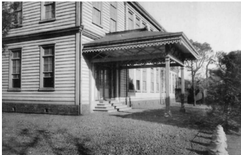
写真1. 有志共立東京病院の外来棟 (A, B, C, D). 上: 受付玄関から診察所をみる。 中: 診察所。向こうに見える玄関と屋根は便殿 (F)。 下: 便殿 (皇后陛下のお休み所) の玄関。

(ベッド数 20-30) もあったはずであるが、今となっては推測する資料もない。この図の A, B, C, D の北側に見られる多くの建物はすべてその後新築されたものであるから、古い建物は次々解体されながら新しい建物に置き換わっていったものと考えられる。