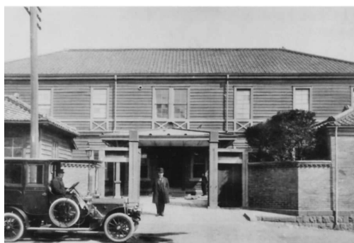
写真6. 上は、9（組織学準備室）、10（物理・化

写真5. 上はその新校舎（の前棟）を道路側（南側）から写したものである。1階右（東側）は図書室、左（西側）は事務室、2階の左右に2つの講義室があった。後棟には1階に病理解剖室、2階に病理実習室があった（この病理学関係の室は、明治44年に新しい病理学関係の建物ができるとき、動物学関係の室に変わった）。