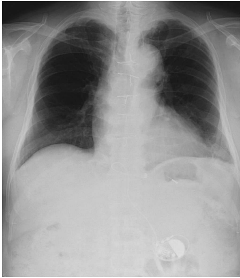
Fig. 2. Postoperative Chest XP After removal of all infected pacemaker system using cardiopulmonary bypass. Myocardial lead and new generator implantation.