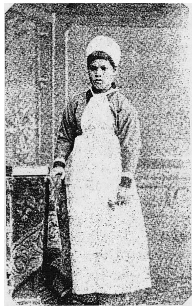
写真1. 明治20年頃の看護婦生徒の服装 高木の希望どおりに作られている